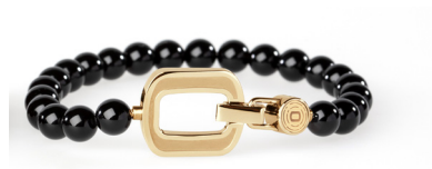
ORGANO Vital Onyx-Armband, Gold